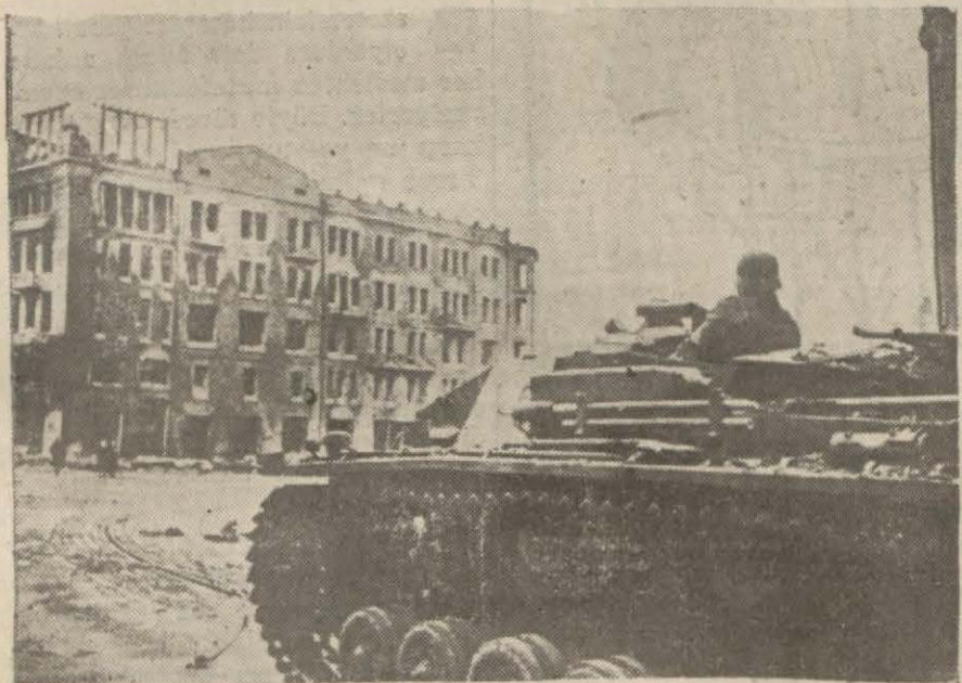
Sovyet taarruzunun hedefi: Harkof şehrinde Alman tankları

Ebedî Şef, Türk vatan ve istiklâlini kurtarmak üzere 23 yıl önce bugün Samsunda Anadolu topraklarına ayak basmıştı