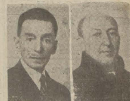
General Kadri Raşid Anday Baro Reisi Mekki Hikmet Gelenbeğ na kanaat getirirse, bunu önleyecek kanunlar yapar; harb kazançları (Devamı 6 nci sayfa)

— Kazancın tahdidî fikrine şimdilik taraftar değilim. Zira yalnız bizde değil, her memlekette vatandaşların kazanç seviyesi bir değildir ve bir olamaz; Harb halinin doğurduğu kazançlara gelince; devlet bu gibi kaçamak kazançlar olduğu-